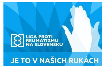
Logo Svetového dňa reumatizmu a slogan kampane.