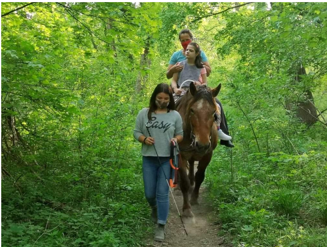
Hipoterapia v terapeutickom centre HipoCanis