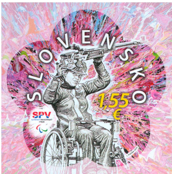
Poštová známka PH Tokio 2021

„Vždy pred paralympijskými hrami organizujeme viacero sprievodných akcií. Tohto roku sme sa museli obmedziť na uvedenie maskota a oblečenia výpravy, ktoré sa konalo 15. júla na pôde generálneho partnera Slovenského paralympijského tímu Tokio 2020 SPP, a s.. Už vlni v auguste sme takto uviedli do života poštovú známku PH Tokio, hoci už bolo jasné, že hry sa posunú o rok. Ale zrejme aj to prispelo k tomu, že známka sa okamžite stala zberateľskou raritou.“